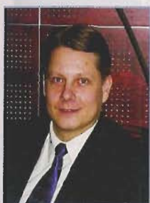
Jokinen: „Die Innovation an Thermera ist, den umweltfreundlichen Grundstoff Betain zu verwenden.“

Jokinen: Nur in der Theorie. 1996 hat bei uns die Entwicklung mit ausführlichen Labortests angefangen, um alle Daten zu prüfen und alle Sicherheitsrisiken auszuräumen. Im gleichen Jahr haben wir dann auch das Fortum-Hauptgebäude und das Nokia-Gebäude auf Thermera umgerüstet und die Betainproduktion mit dem Betainhersteller Danisco optimiert. Weitere Feldtestanlagen stehen in Skandinavien und in den Niederlanden. In Deutschland wird eine Anlage bei der ONI Wärmetrafo GmbH, Lindlar, mit Thermera als Wärmeträger betrieben. 1996 wurde auch die Patentierung vorgenommen, so dass heute die thermodynamischen Eigenschaften von Betain in einer Anwendung als Kälte- oder Wärmeträger gut geschützt sind.